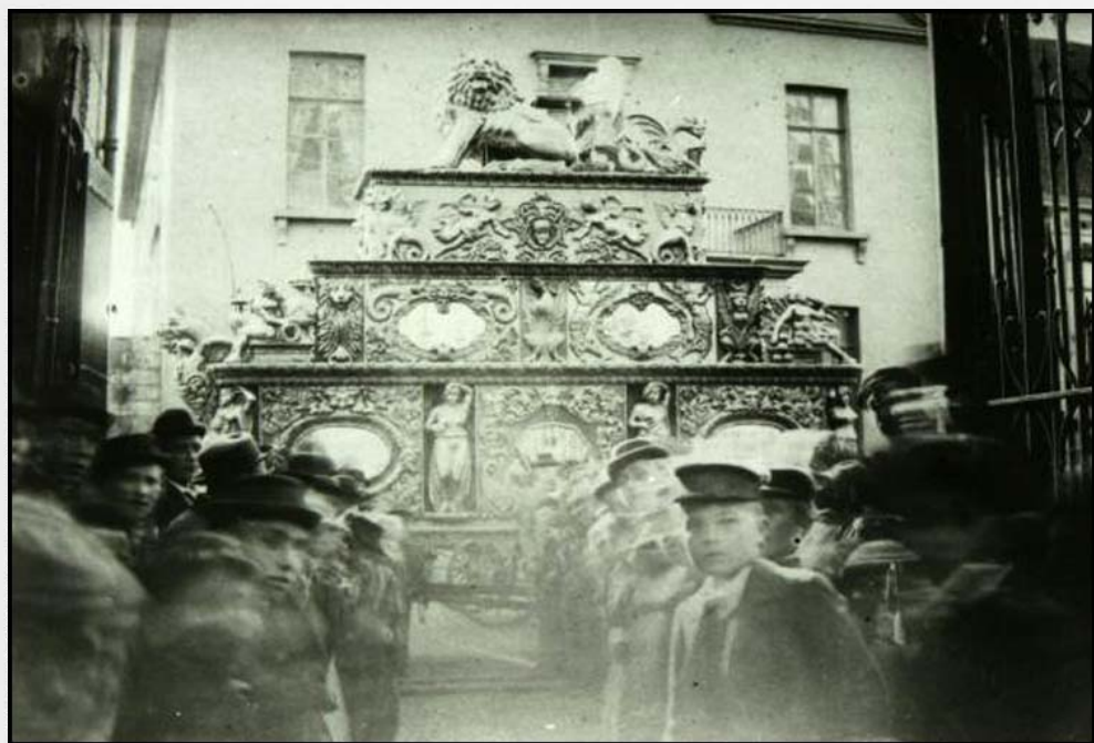
Wagon for the play, at the High Street, London, 1880. The float was used for the play 'The Lion and the Lamb' at the High Street, London, 1880. The float was used for the play 'The Lion and the Lamb' at the High Street, London, 1880.